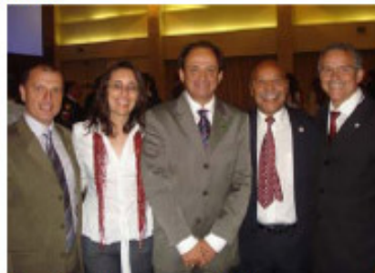
Coordenadores e o anfitrião.