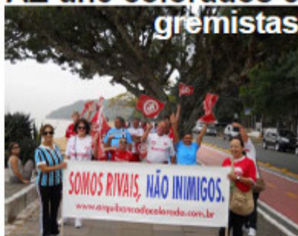
Observadores aprovaram e aderiram à iniciativa.

A caminhada encerrou-se no final da ciclovia, esquina da Avenida Guaíba com Avenida Osvaldo Cruz. Estima-se que mais de 100 pessoas chegaram ao final do trajeto em sinal de apoio à paz entre as duas torcidas. O slogan "Somos rivais, não inimigos" foi o sentimento do encontro que uniu