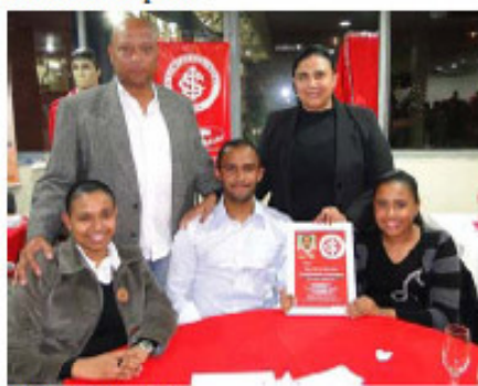
Pinga e família.